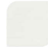
NPIU 2031 BS 00A01 Cloud