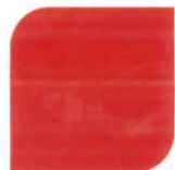
NPIU 2025 BS 537 Signal Red (SC)