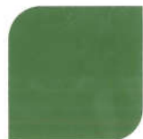
NPIU 2014 BS 206 Brunswick Green (SC)