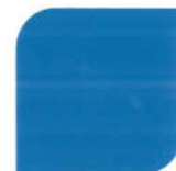
NPIU 2021 BS 18E53 Bright Blue