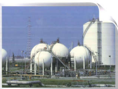
HEAVY DUTY COATINGS Industrial Colours

Các sản phẩm sơn bảo vệ của Nippon Paint cũng rất phù hợp đối với các bề mặt bê tông như sân nhà, buồng lò, cầu bê tông, và các nhà máy xử lý nước và chất thải.