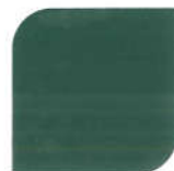
NPIU 2016 BS 14C39 Everglade