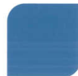
NPIU 2022 Signal Blue (SC)