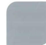
NPIU 2033 BS 18B21 Silver Streak