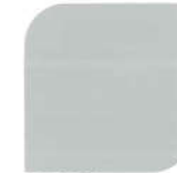
NPIU 2032 Dauphin Gray