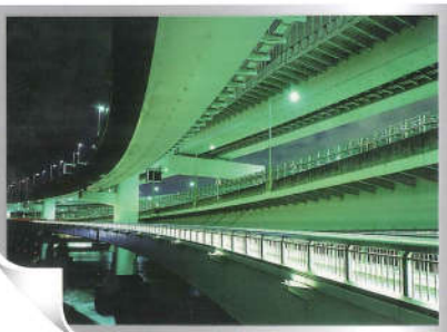
PROTECTIVE COATINGS Architectural Colours