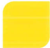
NPIU 2012 Shell Yellow (SC)

Hệ thống sơn sơn phủ công nghiệp của Nippon Paint bao gồm sản phẩm Nippon Paint EA9 dành cho các bề mặt nhôm, thép, bề mặt mạ kẽm và bề tông trong môi trường ẩm ướt. Bên cạnh đó Nippon Paint EA9, khi sử dụng như lớp sơn phủ bảo vệ cuối cùng, sẽ tăng cường khả năng ngăn ngừa ảnh hưởng hóa chất cho các sản phẩm công nghiệp hoặc kết cấu thép. Loại chống trượt cũng sẵn sàng để đáp ứng theo yêu cầu.