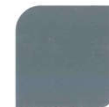
NPIU 2018 BS 18B25 Admiralty Gray