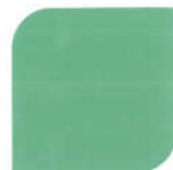
NPIU 2036 Lime Green